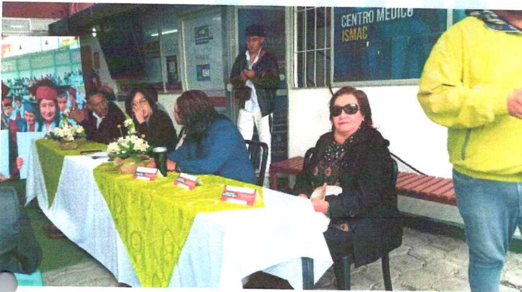
Socialización del proyecto de aguas residuales en el barrio Collaqui