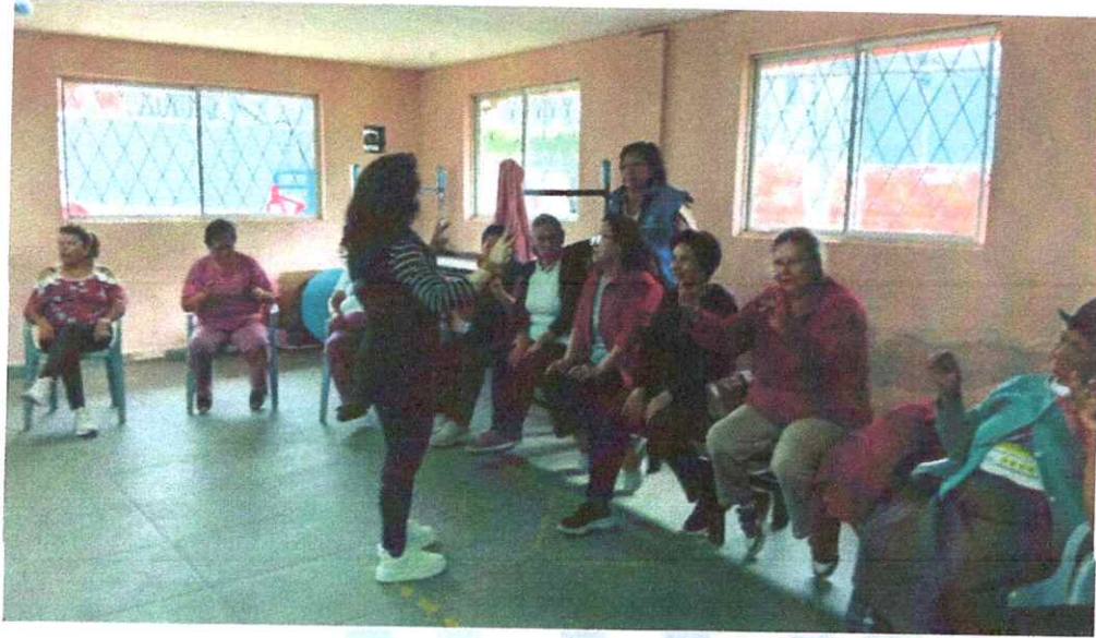
Asamblea nacional de la alimentación diaria de los niños de los CDI'S parte Rural